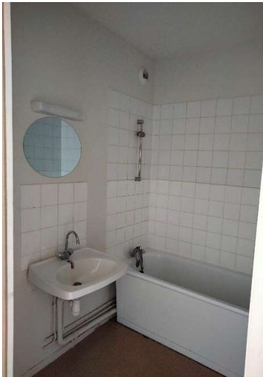
État des lieux : salle de bains T3