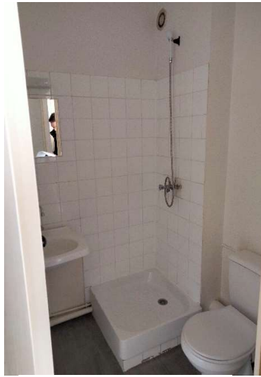
État des lieux : salle de bains T1