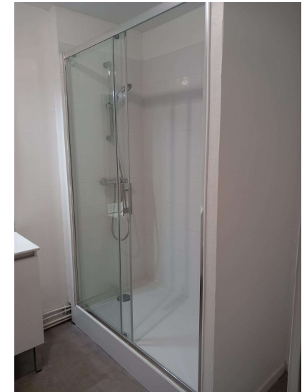
Douche avec porte coulissante