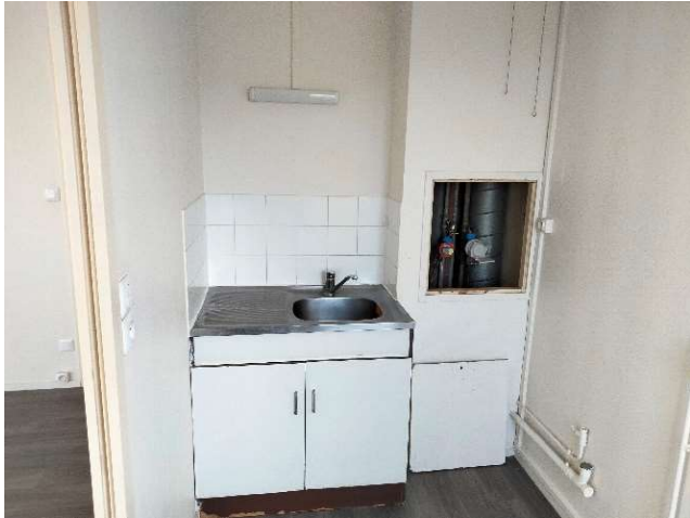
État des lieux : cuisine T1