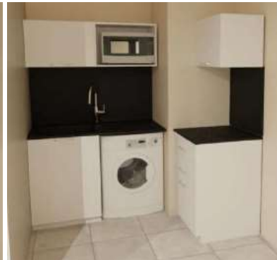
Visuels des futurs aménagements