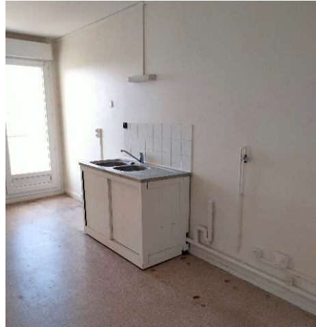
État des lieux : cuisine T3