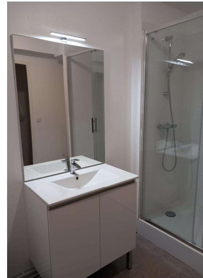
Meuble lavabo avec miroir et éclairage